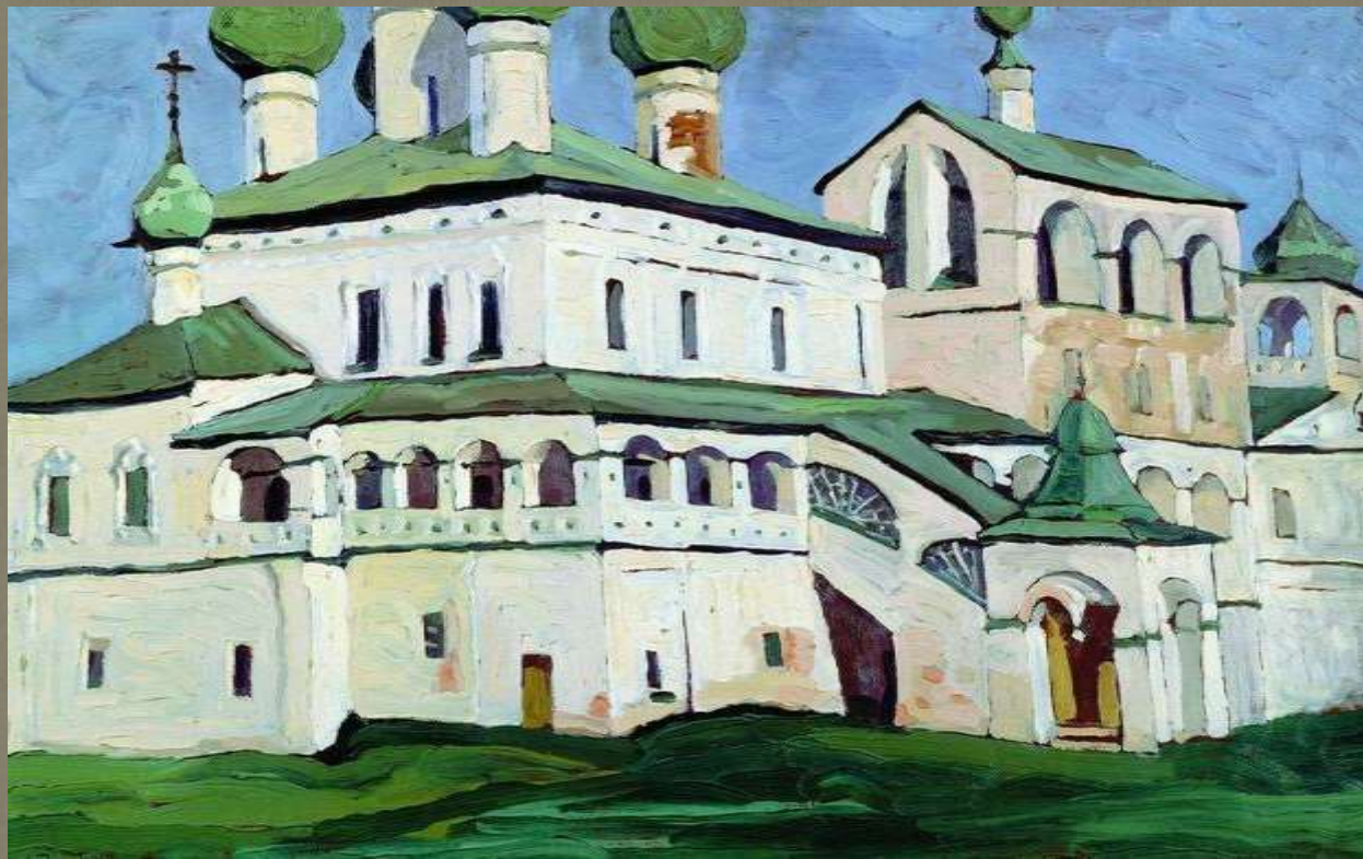
"Воскресенский монастырь в Угличе"